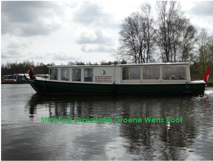
Stichting Exploitatie Groene Wens Boot